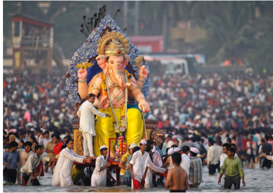
Ganesh Chaturthi, Fête de Ganesha